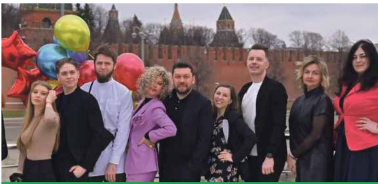
Команда - всегда вместе!

— Естественно. Можем встретиться лично, не вопрос. Поощряем креативных горожан, тех кто публикует интересные фото — публикуем ссылки на страницы или пиарим, скажем так, по-дружески.