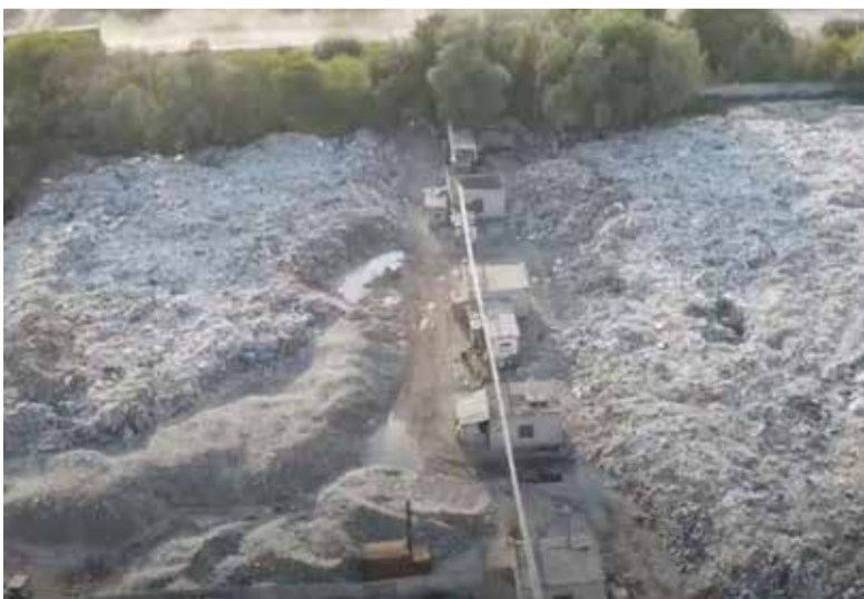
Отсутствие санитарно-защитной зоны — не недочет, не «забыли спросить». Это серьезное уголовное преступление!

Готовность, с которой они предоставляют такие цифры, не удивляет. Мы не поленились, подняли данные за пре-