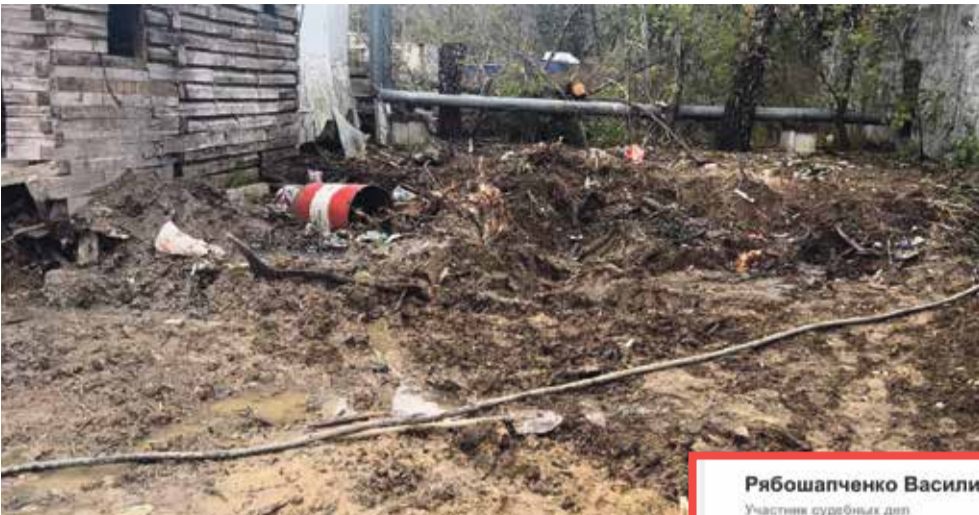
Не сортировочный центр, а просто имитация полезной деятельности?